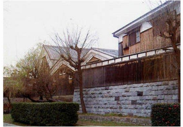
月桂冠大蔵記念館