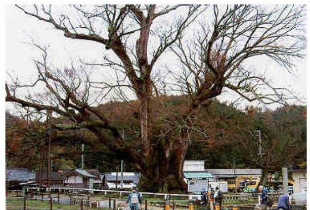
野間の大ケヤキ 樹齢 1000年以上 幹周 14m 高さ 30m