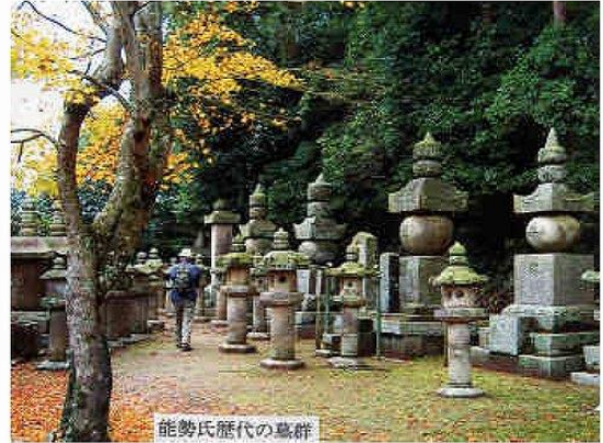
能勢氏歴代の墓群