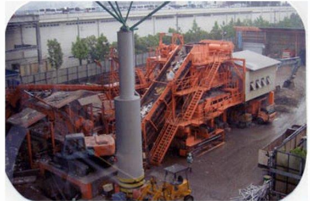
運ばれてきた廃棄物を風雨にさらすことなく大屋根の下で前選別