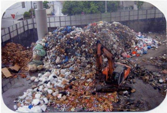
本社工場焼却能力240t/日