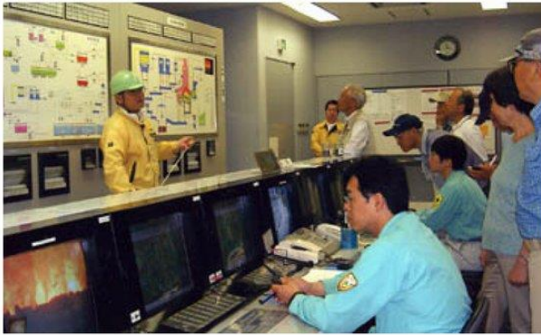
中央操作室(24時間焼却状況を監視)