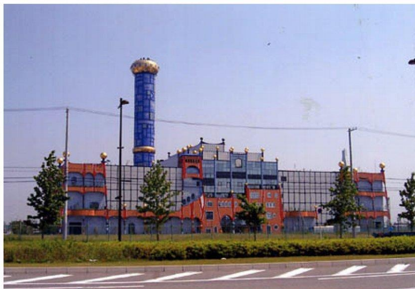
オーストリアのフリーデンスライヒ・フンデルトヴァッサー デザイン

下水・汚泥を効果的に処理し、建設資材等に利用することを目的にした施設 時間: 1000~1130 内容: レクチャ・ビデオ・場内見学