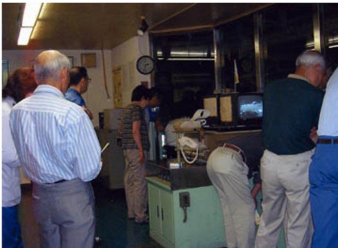
クレーン操作室からゴミピットを見る。 ピット容量6000立米 クレーン一回掴み約3トン