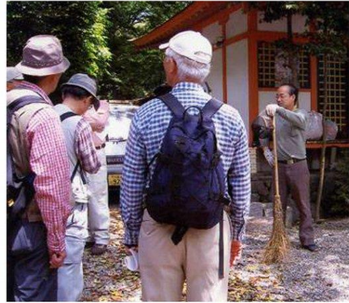
宮司さんのお話を聞く