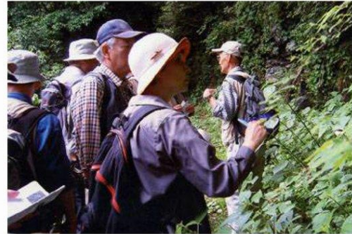
赤鹿さんのガイド