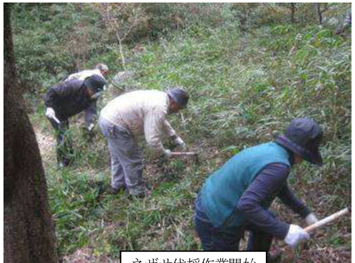
ネザサ伐採作業開始