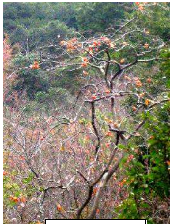
実だけを残したカキノ