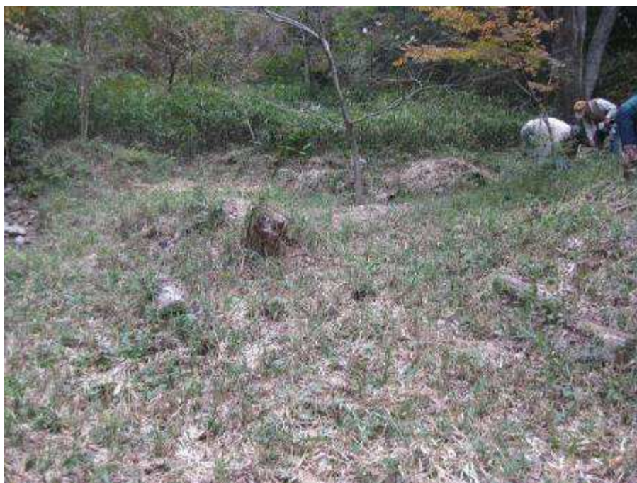
前回の整備箇所と未整備部分(上部)

活動内容は一部調査域の整備も行ったが、上部に広がるネザサの伐採を中心に行った。上部のネザサは春の伐採から7カ月が経過しており(途中、都市環境・緑化Gで活動を企画したものの雨で2回中止となった)、勢いよく育ったネザサを全員で伐採した。ネザサの生育が抑えられつつある調査域では、ネザサ以外の植物はどのように変化していくのか? 来春には植生調査を行いたい。