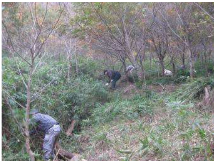
溝を越えて左斜面も