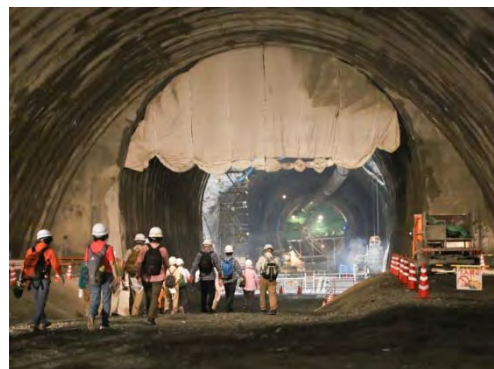
天ヶ瀬ダム工事現場