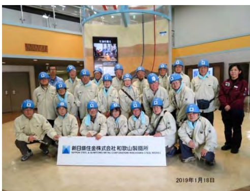
新日鐵住金 和歌山製鐵所