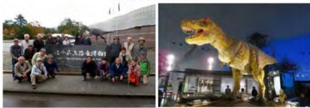
1 恐竜博物館 1 白山平泉寺境内 1 恐竜展示 1 大野城にて