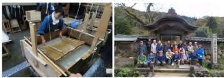
1 砥漕き美田 1 永平寺山門 1 朝倉経訓聖門にて 1 夕暮会館前