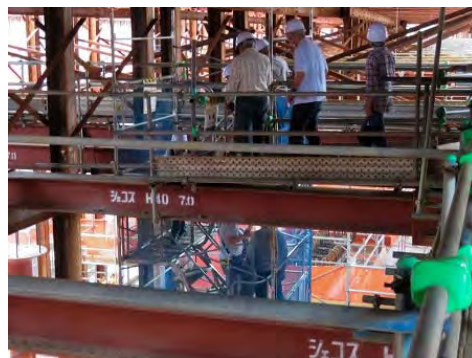
北梅田地下駅工事現場