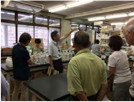
大阪市立環境科学研究センター 水質検査室