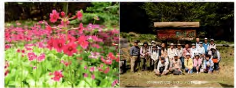
クリンソウ群生地にて