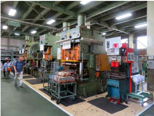
山岡金属工業 工場現場