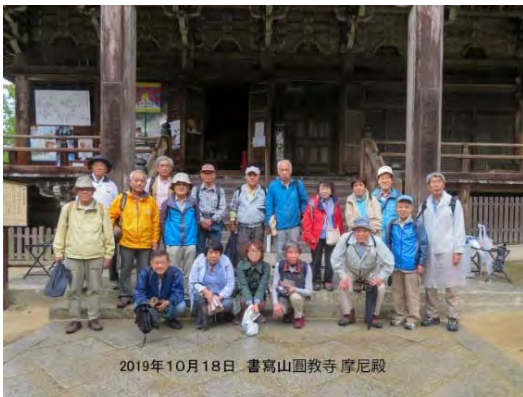
2019年10月18日 書寫山円教寺 摩尼殿