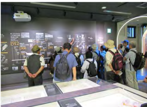
琵琶湖疎水記念館