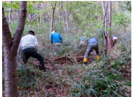
ネザサ狩り作業中