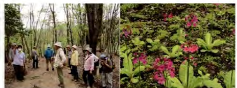
遊歩道~クリンソウ園地 散策開始~

沢山のクリンソウの株数は確認できたのですが、お花は前とか我々に合わせて（？）咲き始めたばかりでした。花は花茎を中心に円状につき、それが数段に重なる姿が仏蘭の麗根にある「丸輪」に似ていることが、名前の由来になっているのですが、まだ2~3段位だったでしょうか。（見頃は5月末頃の様です。）