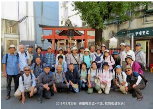
2019年9月20日 茶屋町周辺・中国、能勢街道を歩く