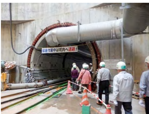
守口調整池築造工場現場