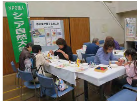
なにわエコ会議「環境ふれあい広場 in 浪速」