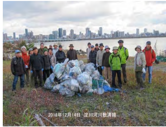
2018年12月14日 淀川河川敷清掃