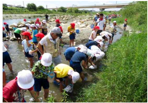
明峰小学校の環境学習