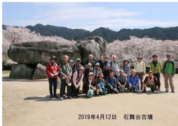
2019年4月12日 石舞台古墳