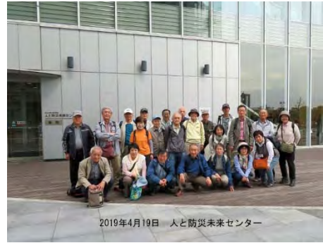
人と防災未来センター