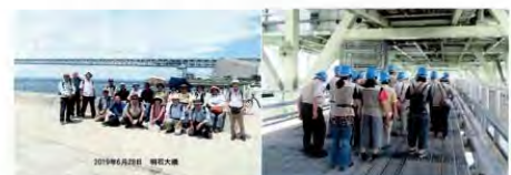
2019年6月28日 明石海峡大橋

レジャーシート、ヘルメット、イヤホン・専用ジャケットを各自持参。 2組（10名と9名）に分れ、夫々担当者ご案内で、橋梁の管理通路（自動車専用道路の下部約15m）をウォーキング。北側主塔下まで約100m。海上約80mでグレーティング多道。海を眺めながらの途中散歩。主塔では専用のエレベーターにて上室30メートルの展望へ。 主塔頂上での眺望は素晴らしく、淡路島・小豆島・宍粟及び六甲山系を眺望。 各々写真を撮り、自然と環境科の参加者全員の集合写真も。