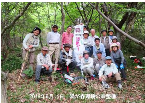
2019年6月14日 渦が森環境の森整備