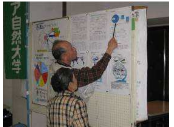
クイズの説明に奮闘